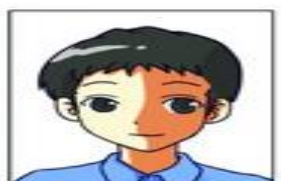
Shadow over the face