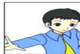
Daily life Photo