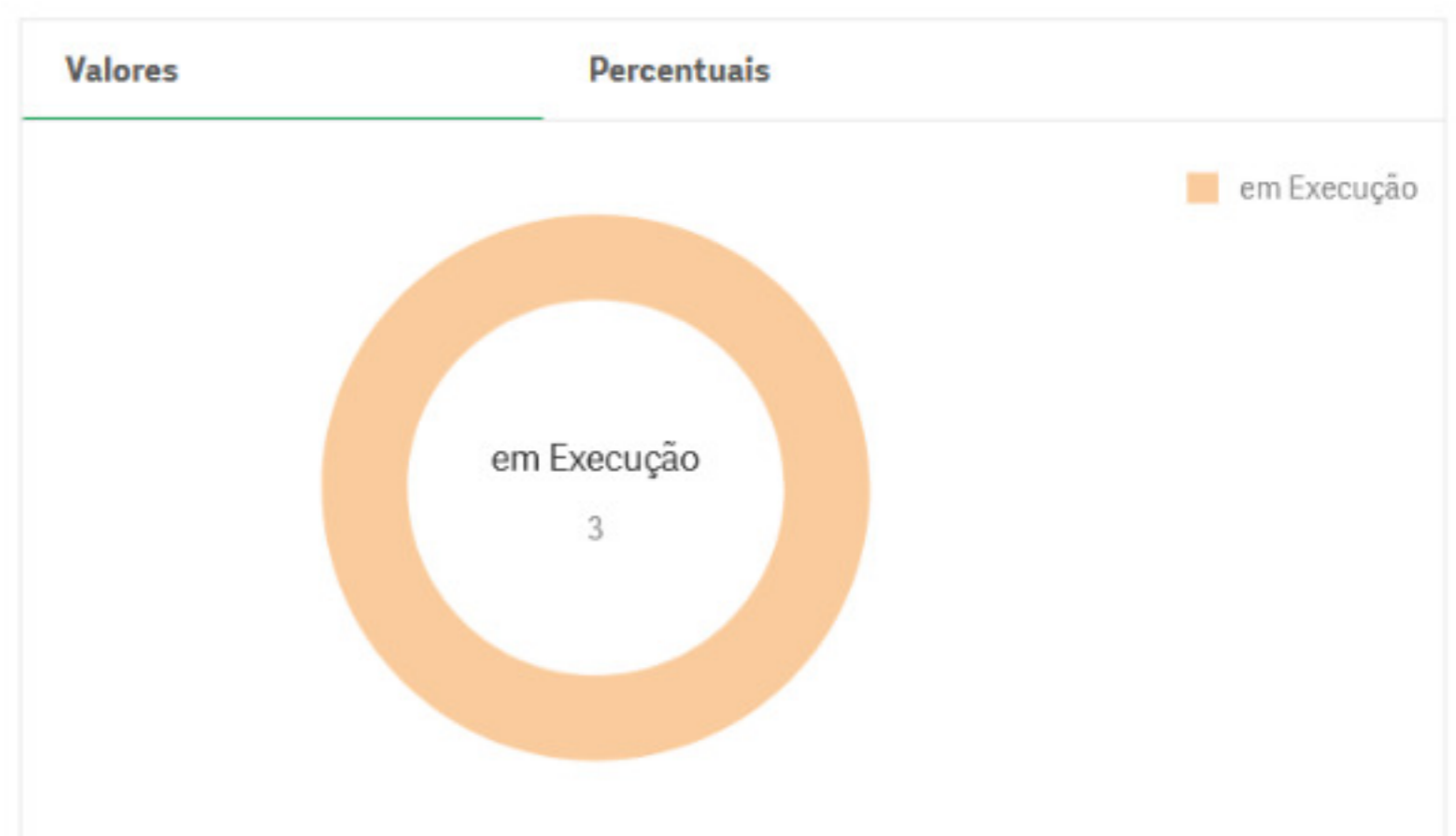
Situação dos Instrumentos Assinados - Agrupado

Instrumentos Assinados: 3 | % Assinatura de Instrumentos: 75,00%